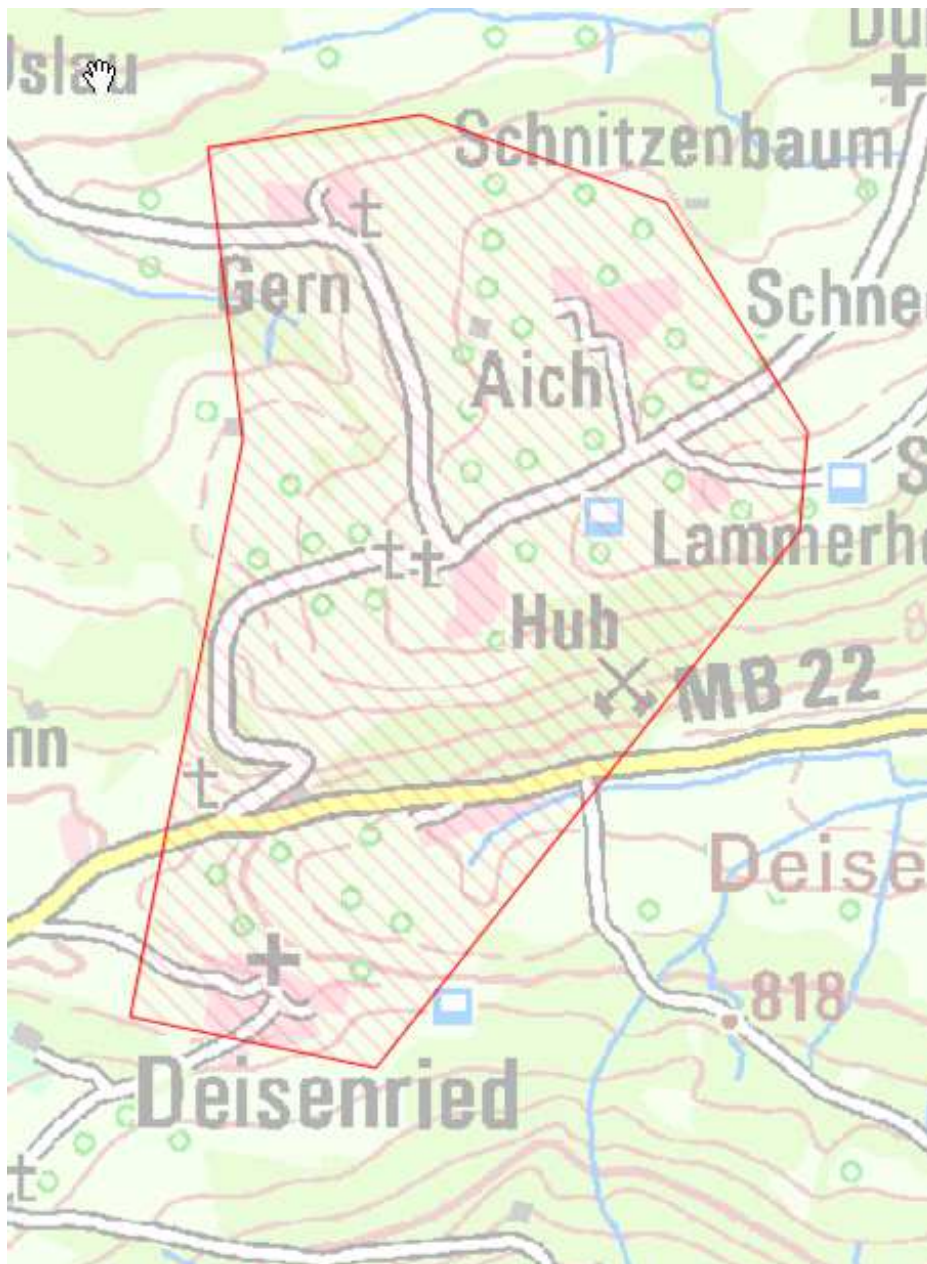
Karte 3: Ortsteile Deisenried, Hub, Aich, Gern

Nach dem Auf- bzw. Ausbau sollen in diesem Bereich Übertragungsraten von mindestens 50 Mbit/s im Download für einen Teil und nicht weniger als 30 Mbit/s im Download für alle möglichen Endkunden sowie Upload-Geschwindigkeiten, die viel höher sind als bei Netzen der Breitbandgrundversorgung (mindestens 2 Mbit/s) zu Verfügung stehen.