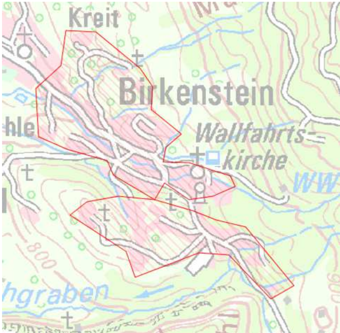
Karte 9: Ortsbereiche Kreit, Birkenstein

Nach dem Auf- bzw. Ausbau sollen in diesem Bereich Übertragungsraten von mindestens 50 Mbit/s im Download für einen Teil und nicht weniger als 30 Mbit/s im Download für alle möglichen Endkunden sowie Upload-Geschwindigkeiten, die viel höher sind als bei Netzen der Breitbandgrundversorgung (mindestens 2 Mbit/s) zu Verfügung stehen.