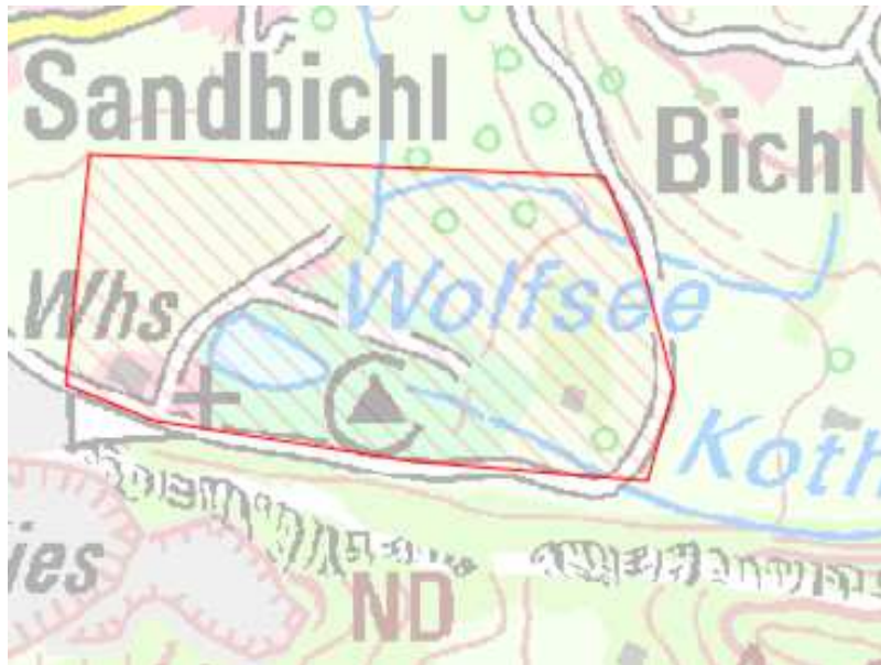
Karte 10: Los 2, Ortsbereich Wolfsee

Nach dem Auf- bzw. Ausbau sollen in diesem Bereich Übertragungsraten von mindestens 100 Mbit/s im Download und von mindestens 10 Mbit/s im Upload für alle möglichen Endkunden zu Verfügung stehen (Nr. 1.2 Satz 2 i. V .m. Nr.1.1 BbR).