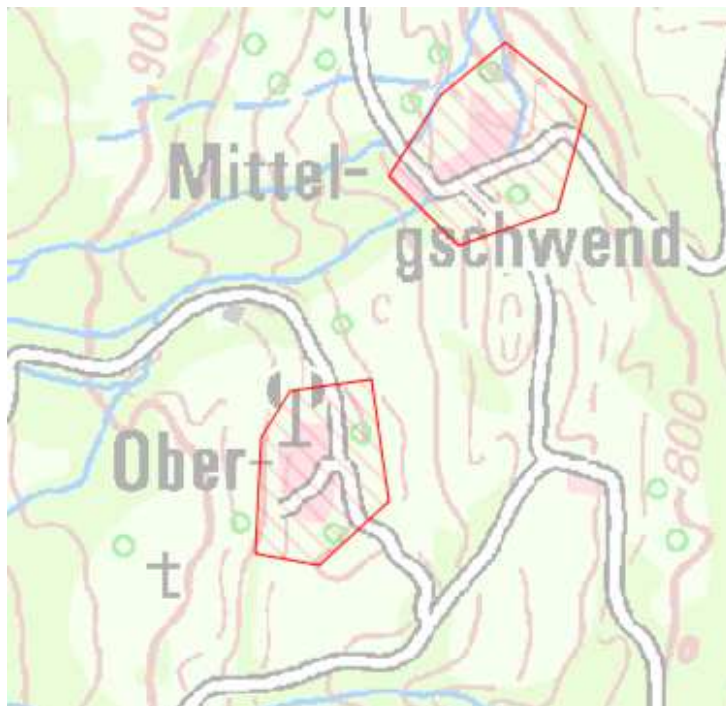
Karte 7: Ortsteile Mittelschwend, Obergschwend

Nach dem Auf- bzw. Ausbau sollen in diesem Bereich Übertragungsraten von mindestens 50 Mbit/s im Download für einen Teil und nicht weniger als 30 Mbit/s im Download für alle möglichen Endkunden sowie Upload-Geschwindigkeiten, die viel höher sind als bei Netzen der Breitbandgrundversorgung (mindestens 2 Mbit/s) zu Verfügung stehen.