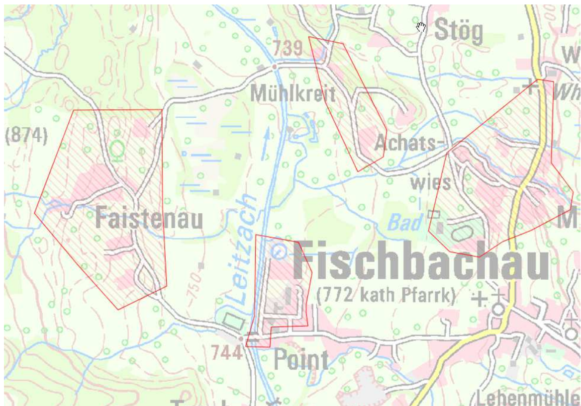
Karte 8: Faistenau, Fischbachau, Mühlkreit, Achatswies

Nach dem Auf- bzw. Ausbau sollen in diesem Bereich Übertragungsraten von mindestens 50 Mbit/s im Download für einen Teil und nicht weniger als 30 Mbit/s im Download für alle möglichen Endkunden sowie Upload-Geschwindigkeiten, die viel höher sind als bei Netzen der Breitbandgrundversorgung (mindestens 2 Mbit/s) zu Verfügung stehen.