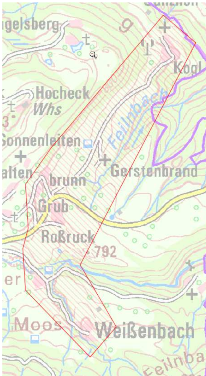
Karte 5: Kogl, Kaltenbrunn, Grub, Weißenbach

Nach dem Auf- bzw. Ausbau sollen in diesem Bereich Übertragungsraten von mindestens 50 Mbit/s im Download für einen Teil und nicht weniger als 30 Mbit/s im Download für alle möglichen Endkunden sowie Upload-Geschwindigkeiten, die viel höher sind als bei Netzen der Breitbandgrundversorgung (mindestens 2 Mbit/s) zu Verfügung stehen.