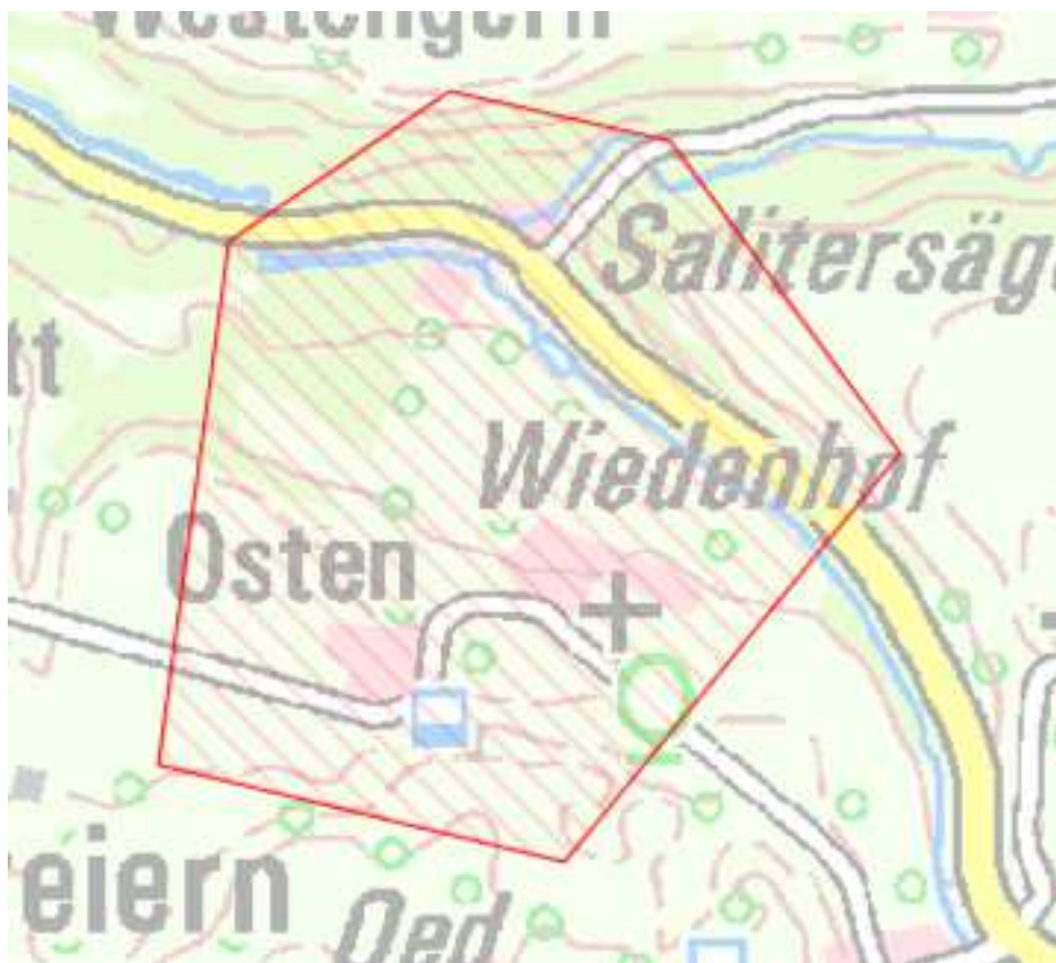
Karte 2: Ortsteile Wieden, Osten, Salitersäge

Nach dem Auf- bzw. Ausbau sollen in diesem Bereich Übertragungsraten von mindestens 50 Mbit/s im Download für einen Teil und nicht weniger als 30 Mbit/s im Download für alle möglichen Endkunden sowie Upload-Geschwindigkeiten, die viel höher sind als bei Netzen der Breitbandgrundversorgung (mindestens 2 Mbit/s) zu Verfügung stehen.